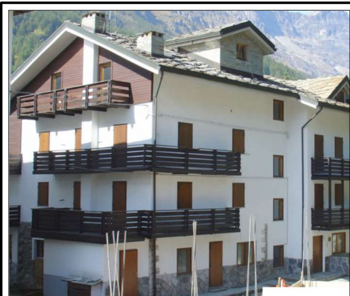
STATO DI FATTO : VISTA DAL PARCHEGGIO

L'intervento prevede la conversione di un edificio esistente con destinazione alberghiera ad una residenza socio-assistenziale per anziani. La mission del progetto è stata di ampliare il fabbricato per ricavare 19 posti letto in camere singole o doppie dotate di servizi igienici ed adeguare l'intera struttura alle normative sismica, di accessibilità ai disabili e di prevenzione incendi, oltre alla sistemazione di un basso fabbricato, ubicato in prossimità dell'edificio principale, per ricavare un locale di deposito al servizio della struttura per anziani e i locali da destinare a sede dell'Associazione Volontari del 118.