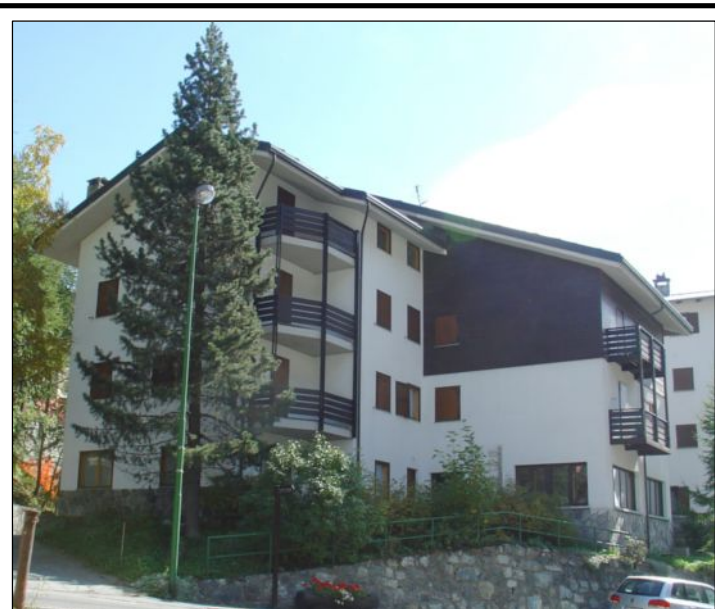
STATO DI FATTO : VISTA DALLA STRADA