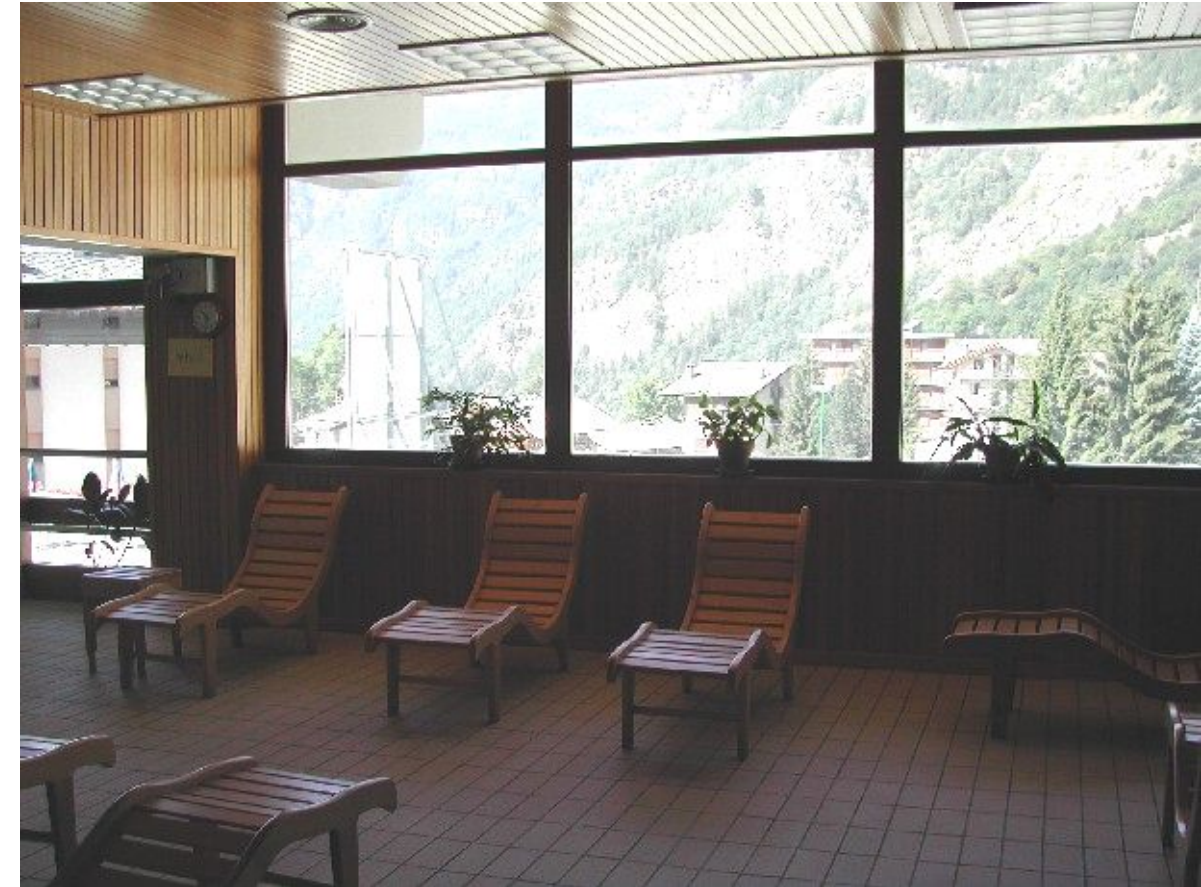
Zona relax del centro benessere al piano secondo

Il coordinamento per la sicurezza in fase di esecuzione è stato svolto in conformità alle normative nazionali e regionali ponendo particolare attenzione alle azioni di coordinamento, di formazione ed informazione del personale impiegato e di verifica e controllo dell'applicazione delle procedure previste dai piani di sicurezza.