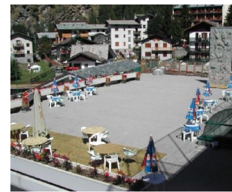
Vista esterna del solarium e muro di arrampicata artificiale