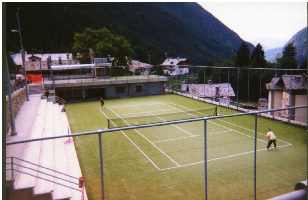
Il tetto piano più alto ospita il campo da tennis, a raso delle gradinate sulla sinistra vi è la strada comunale per Crétaz