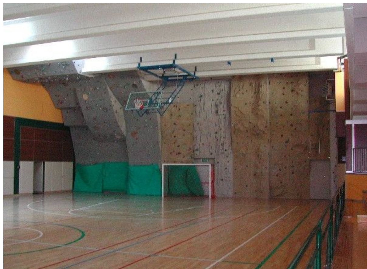
Vista interna della palestra al piano terreno