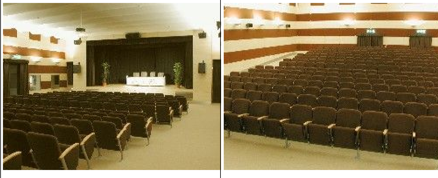
Viste interne del centro congressi al piano terreno