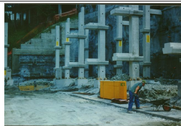
Inizio posa della struttura prefabbricata