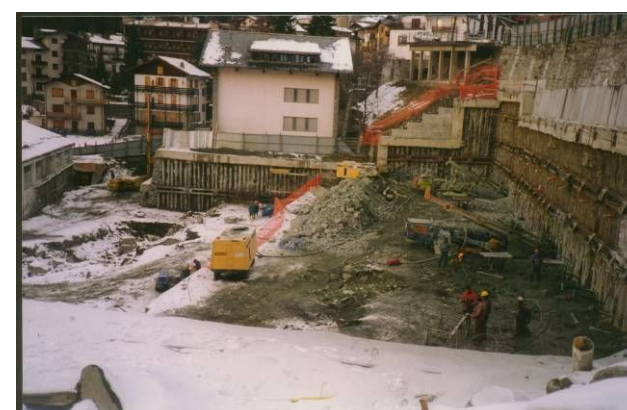
Realizzazione del quarto ordine di tiranti lati nord e est