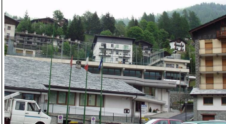
Vista del complesso da piazza Carrel