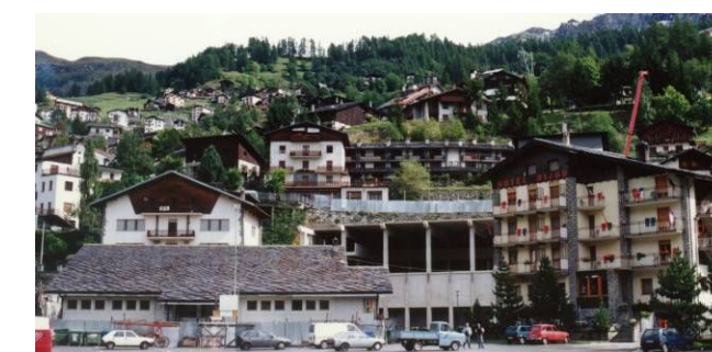
Termine posa della struttura prefabbricata