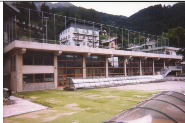
Termine della realizzazione del lastrico solare antistante la piscina coperta

Per l'area destinata a parcheggi viene utilizzata la piazza antistante con capienza di circa 50 posti auto scoperti.