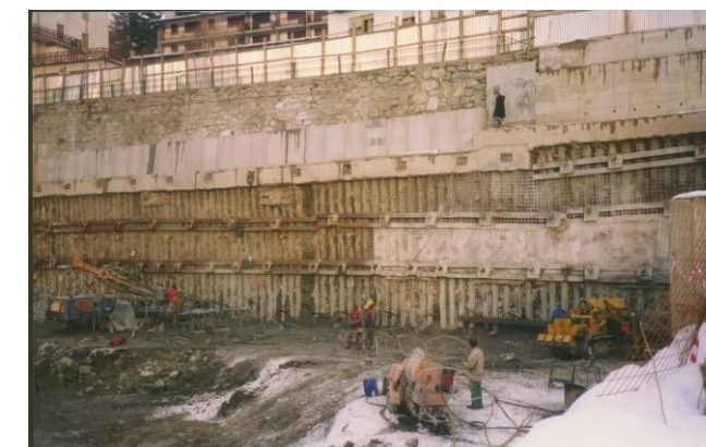
Realizzazione del quarto ordine di tiranti a valle della strada comunale